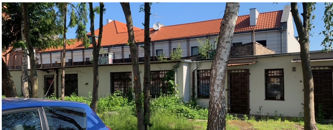
Rys.1 Budynki istniejące do rozbiórki

Posadowienie budynku zaprojektowano jako bezpośrednie na ławach fundamentowych. Na granicy działki zaprojektowano ściany oporowe zintegrowane z nowym budynkiem. Mają one zabezpieczyć istniejące na granicy działki budynki w trakcie budowy oraz podczas eksploatacji.