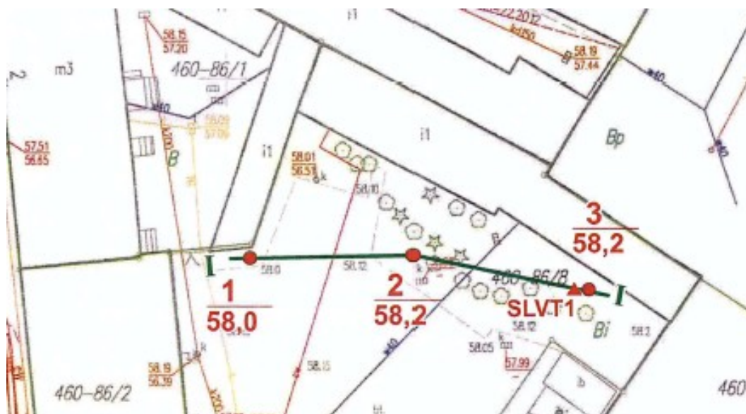
Rys.3 Lokalizacja otworów badawczych