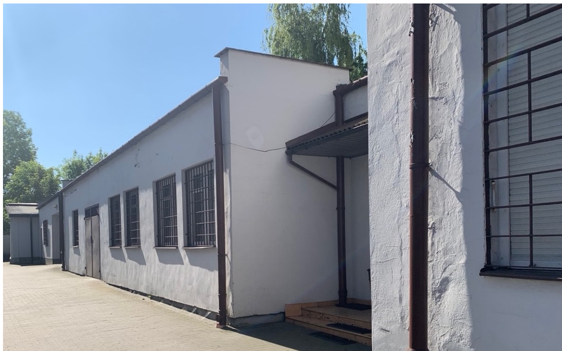
Rys.2 Budynki „sąsiada”